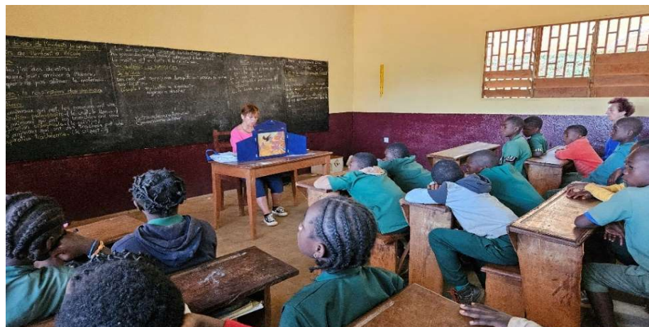
Kamishibai sur le thème de la sensibilisation à la protection de l'environnement