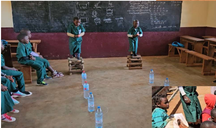
mini billard, lancer d'anneaux, jeux d'adresse, chants et danses....