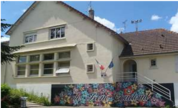
École René Coudoint 78690 Les Essarts le Roi