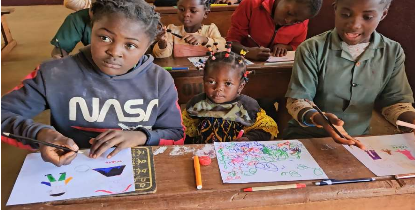
Atelier peinture et dessin

Des ateliers pédagogiques ont été initiés par les participants de la mission provoquant intérêts et étonnements des élèves