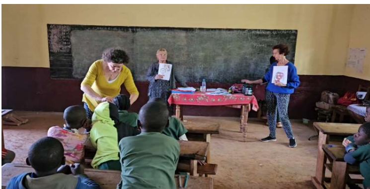
Ecole publique TCHALA Classe CM1/CM2

Un élève a ramassé un peu de terre rouge de la cour de l'école qui est à nue et l'a mise dans un petit sac pour montrer aux élèves que les cours au Cameroun ne sont pas bétonnées comme en France .