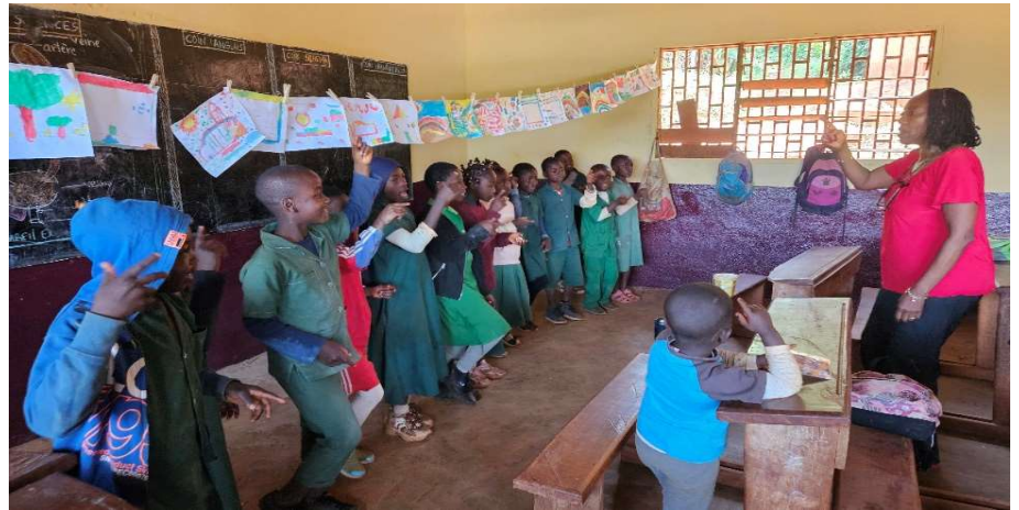
Atelier Chant et danse