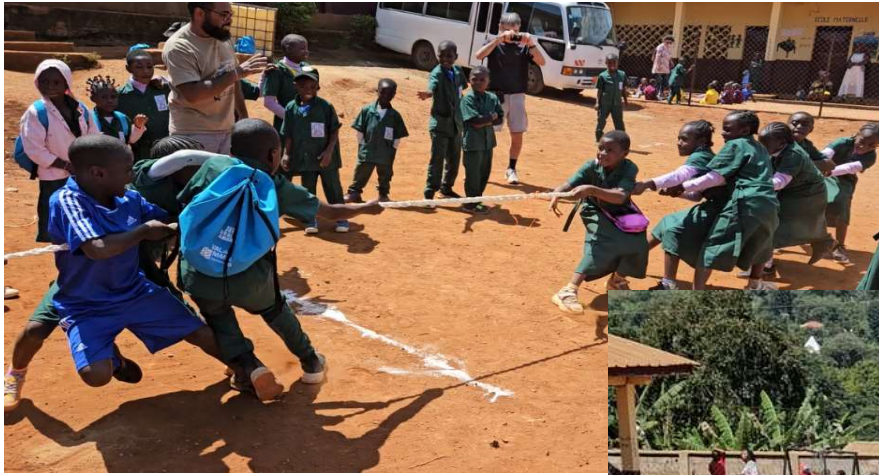
l'incontournable tir à la corde

Pour parfaire ces moments magiques d'échanges et de partages avec les élèves et les enseignants nous avons organisé une Kermesse avec de nombreux stands :