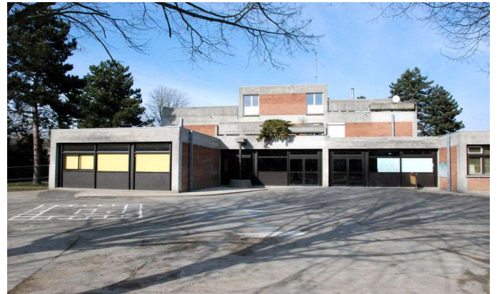
École Charles de Gaulle 77120 Coulommiers