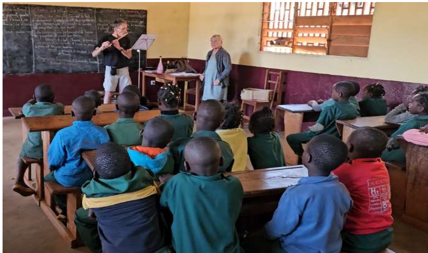
Atelier éveil musical sur le thème "comment produire un son"