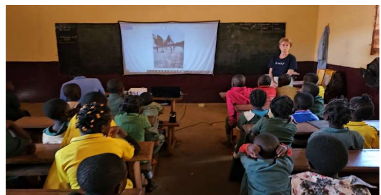
Ecole publique TCHALA Classe CE1/CE2