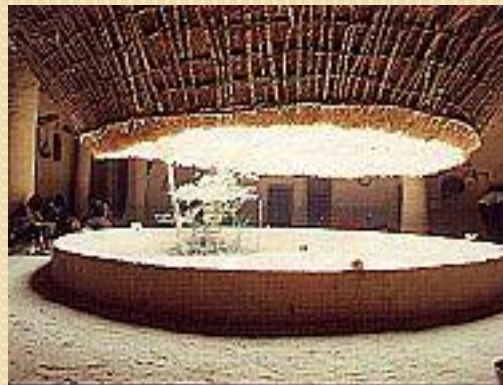
Maison à Impluvium Enapore